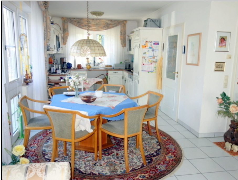
Essen / Küche