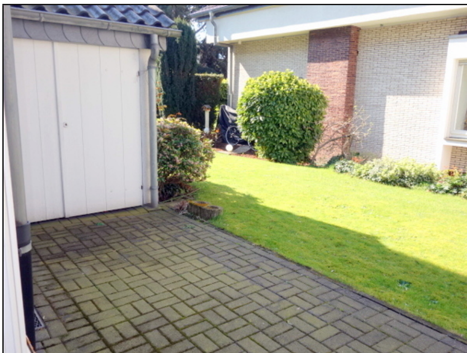
Terrasse u. Geräteraum