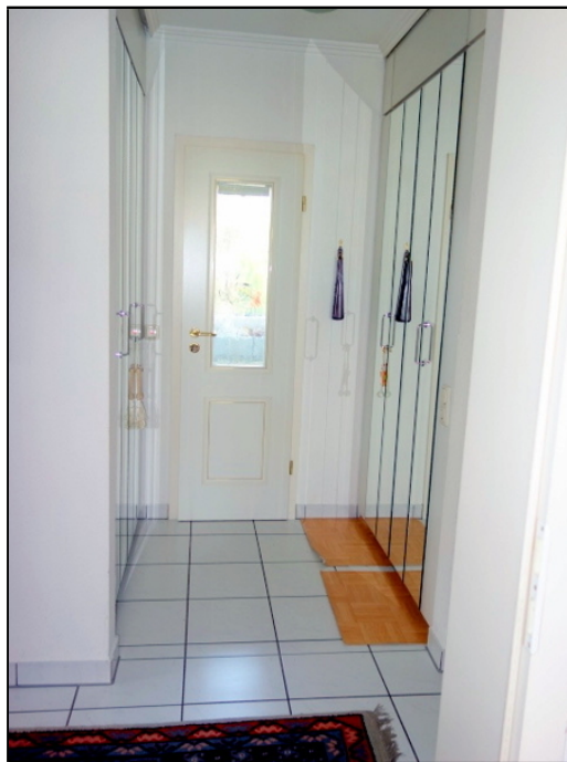
Garderobe u. Abstellraum