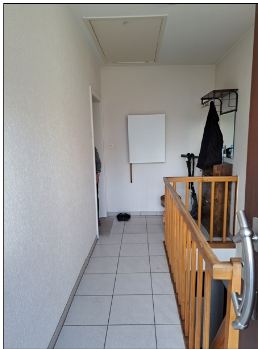
EG Einlieger Zugang