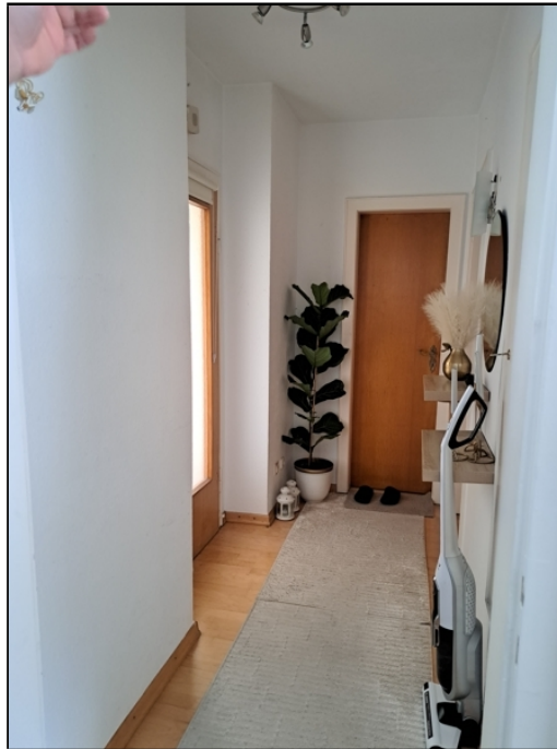
EG Einlieger Flur