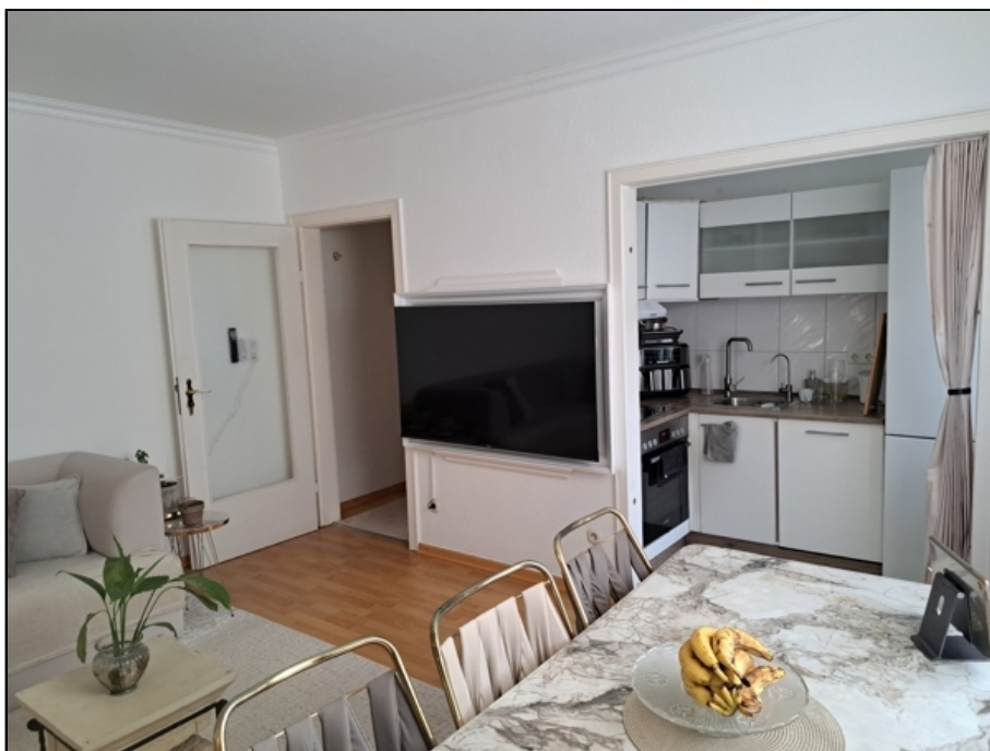
EG Einlieger Wohnen, Kochen