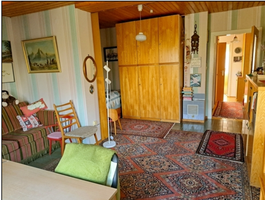
EG Kind 2