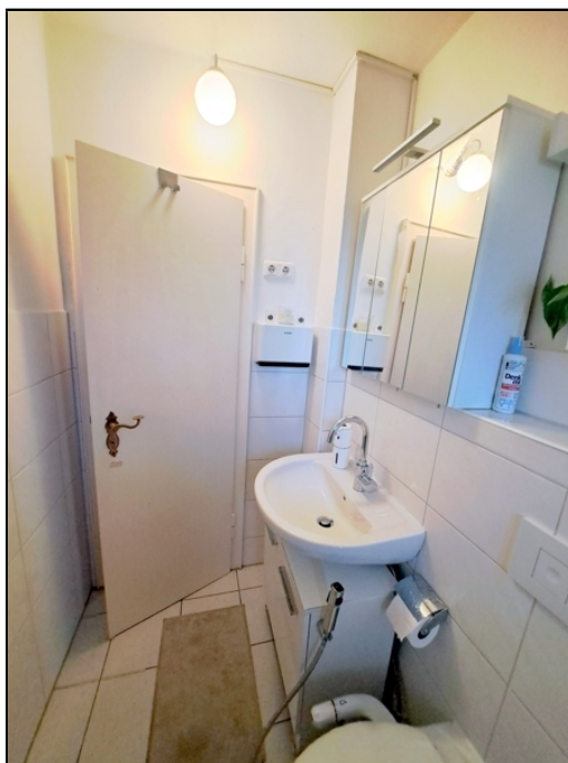
EG Einlieger Bad