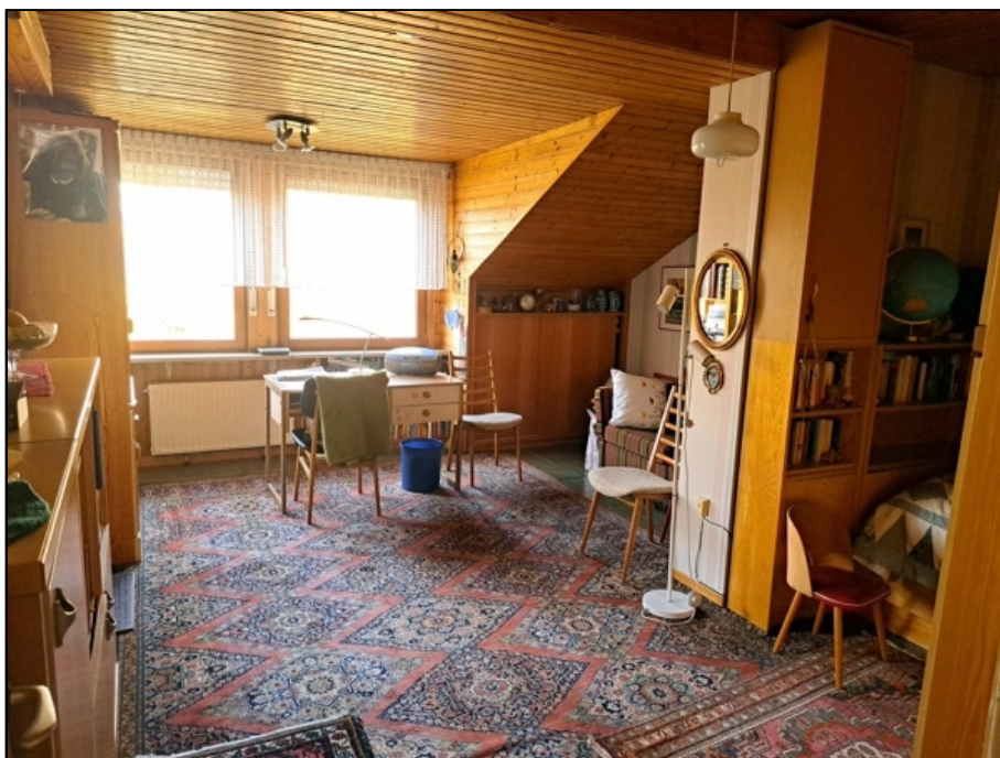
EG Kind 2