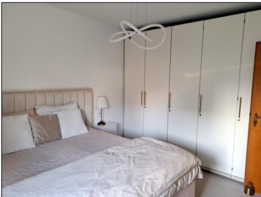
EG Einlieger Schlafen