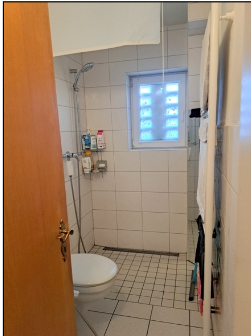
EG Einlieger Bad