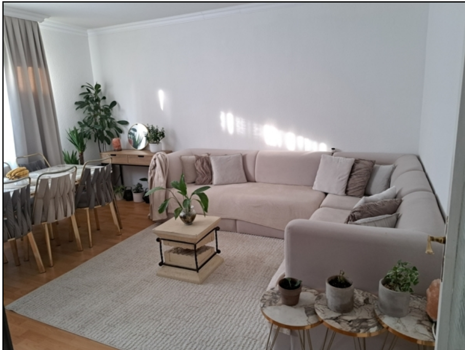
EG Einlieger, Wohnen