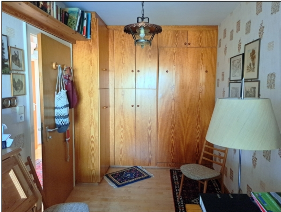
EG Kind 1