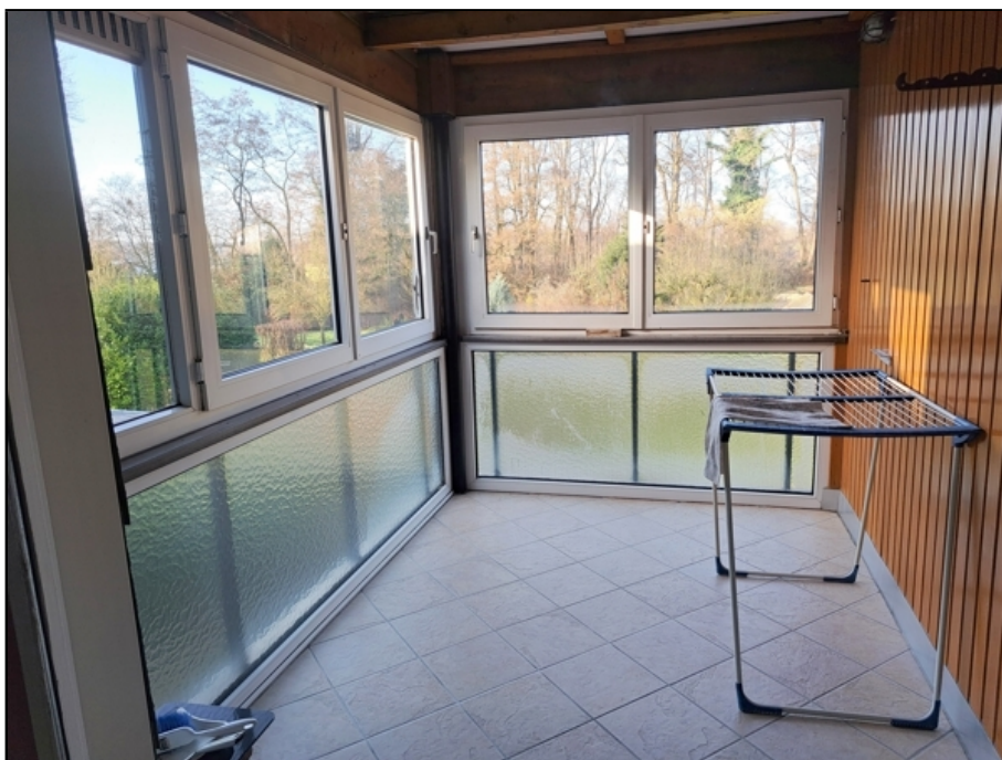
EG Kind 2, Wintergarten