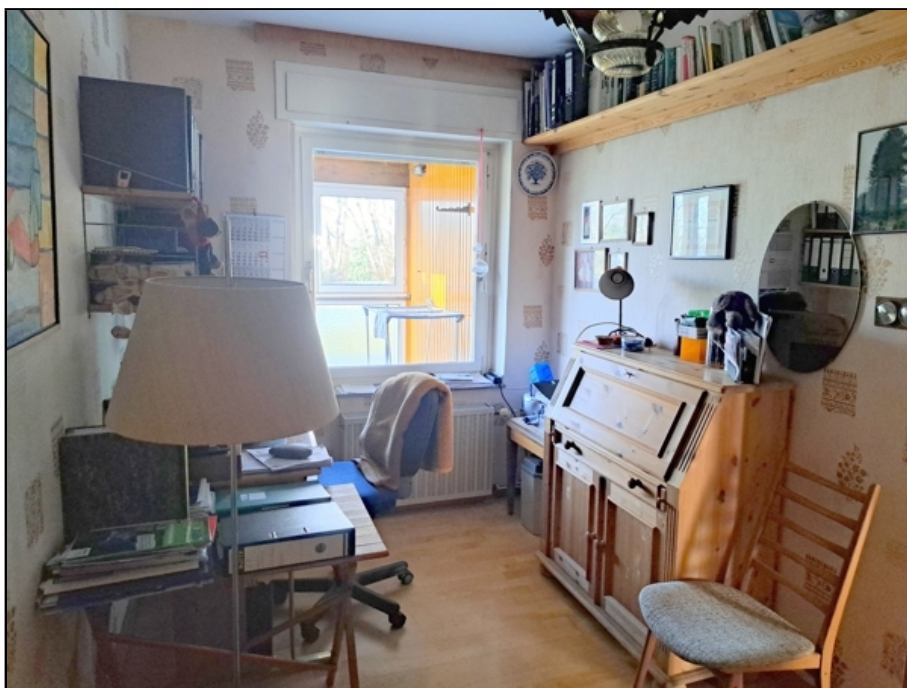
EG Kind 1