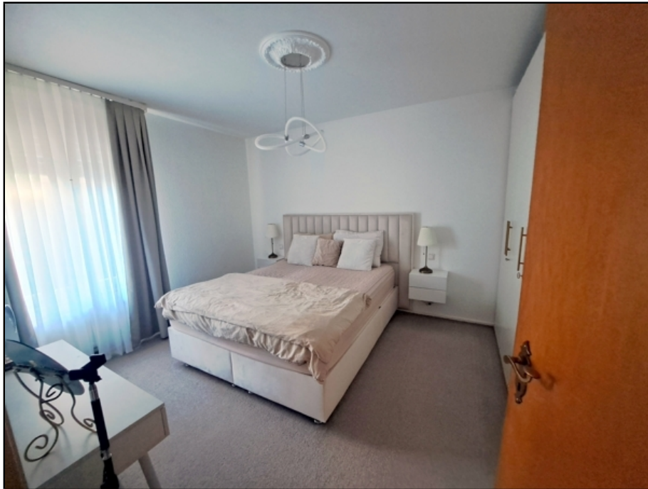
EG Einlieger, Schlafen