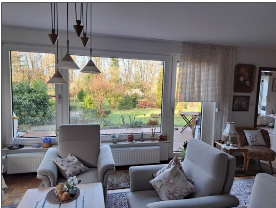
UG Wohnen, Ausblick