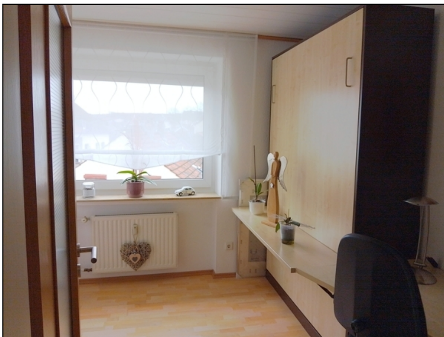
Kind / Büro